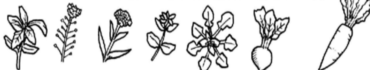
せり なすな ごぎょう はこべ ほとけのざ すすな(かぶ) すずしろ(だいこん)

冬は野菜が不足します。それをおぎなうために、春一番に芽を出す7種類の野菜(草)をおかゆに入れて食べます。家族が健康に過ごせるようにとの願いがこめられています。